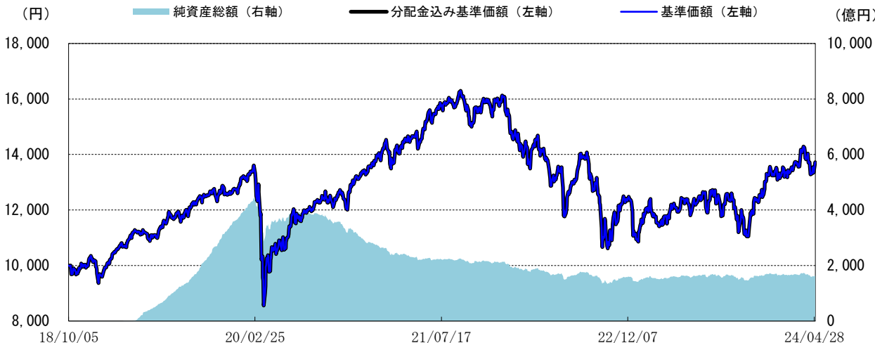
<基準価額の推移グラフ>

※分配金込み基準価額は、当ファンドに分配金実績があった場合に、当該分配金（税引前）を再投資したものと計算した理論上のものである点にご留意ください。 ※基準価額は、信託報酬（後述の「手数料等の概要」参照）控除後の値です。