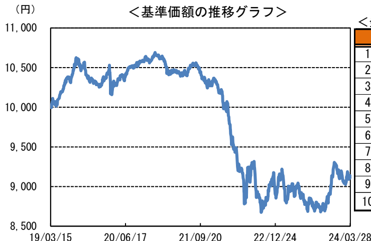
＜発行体別構成比率＞