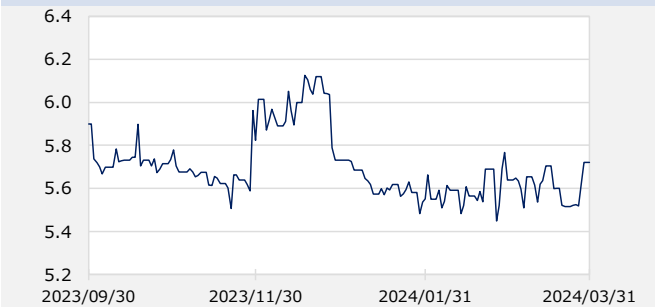
アメリカドルヘッジコスト (%)