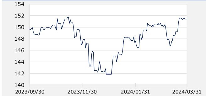
円/アメリカドル (円)