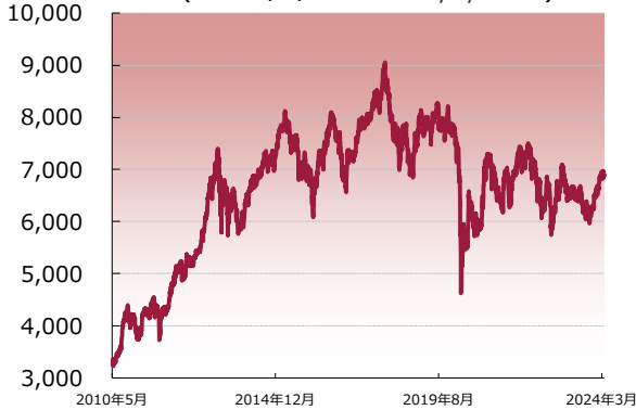
フィリピン総合指数の推移 (2010/5/28 ~ 2024/3/27)