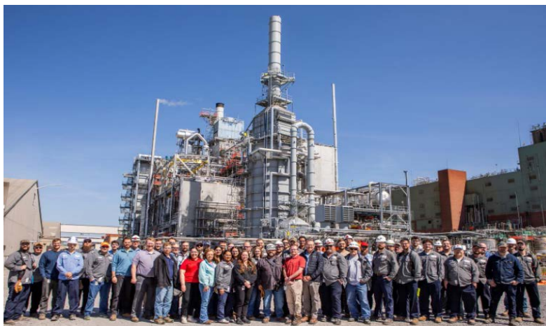
写真1:稼働した世界最大の分子リサイクル工場

当ファンドでは、これらのユニークな分子リサイクルプロジェクトが、同社の売り上げや利益に大きく貢献するとともに、有意義なインパクトを創出することを期待しています。