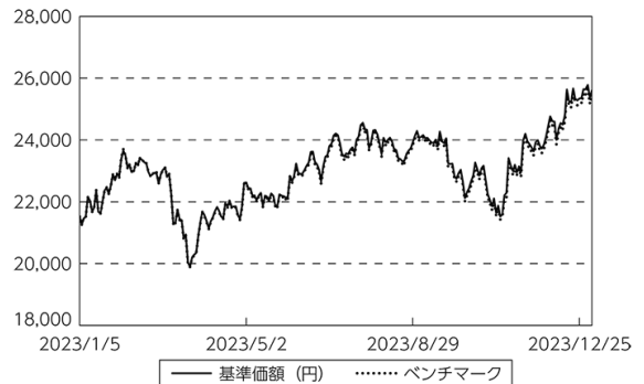
基準価額等の推移

(注) ベンチマークは期首の値をファンド基準価額と同一になるよう指数化しています。